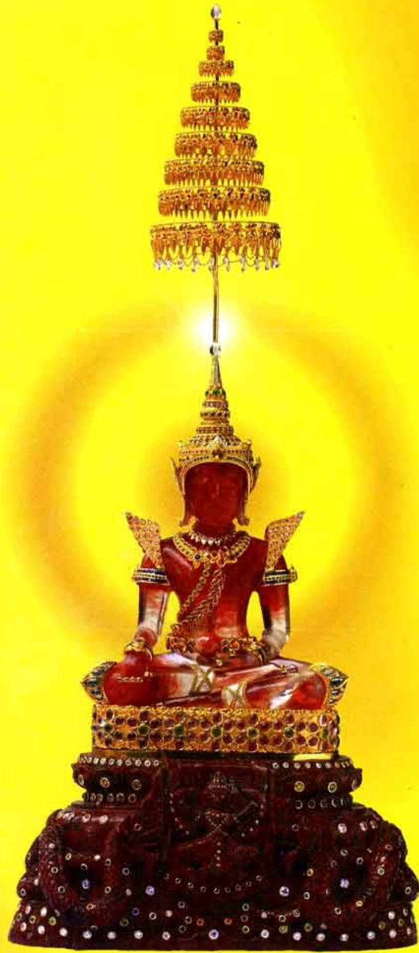
พระแก้วแดง ทรงเครื่องทองคำ

วัดพุทธพรหมปัญโญ ตำบลเมืองนะ อำเภอเชียงดาว จังหวัดเชียงใหม่