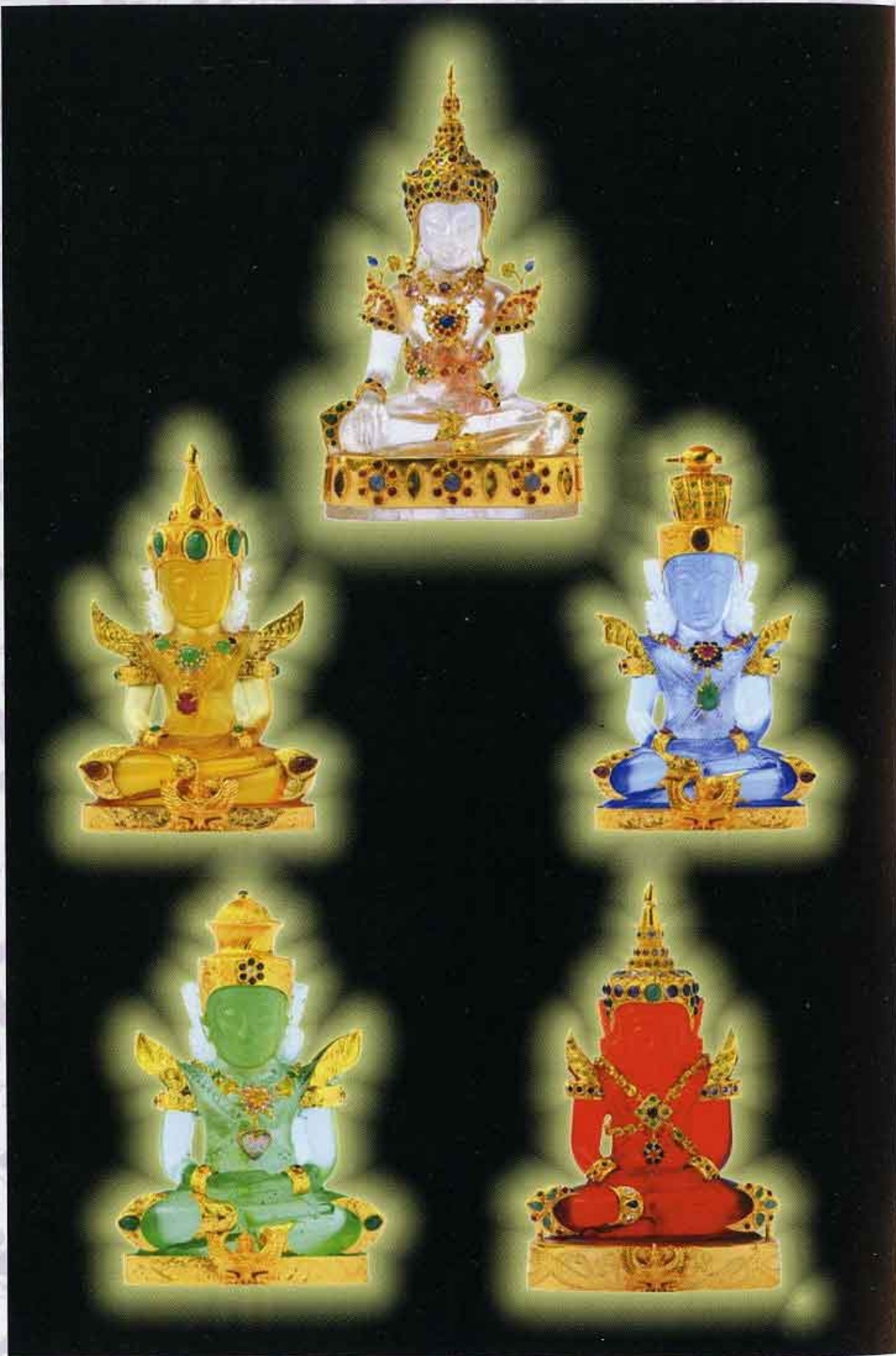
พระแก้ว ๕ พระองค์

วัดพุทธพรหมปัญญา ตำบลเมืองนะ อำเภอเชียงดาว จังหวัดเชียงใหม่