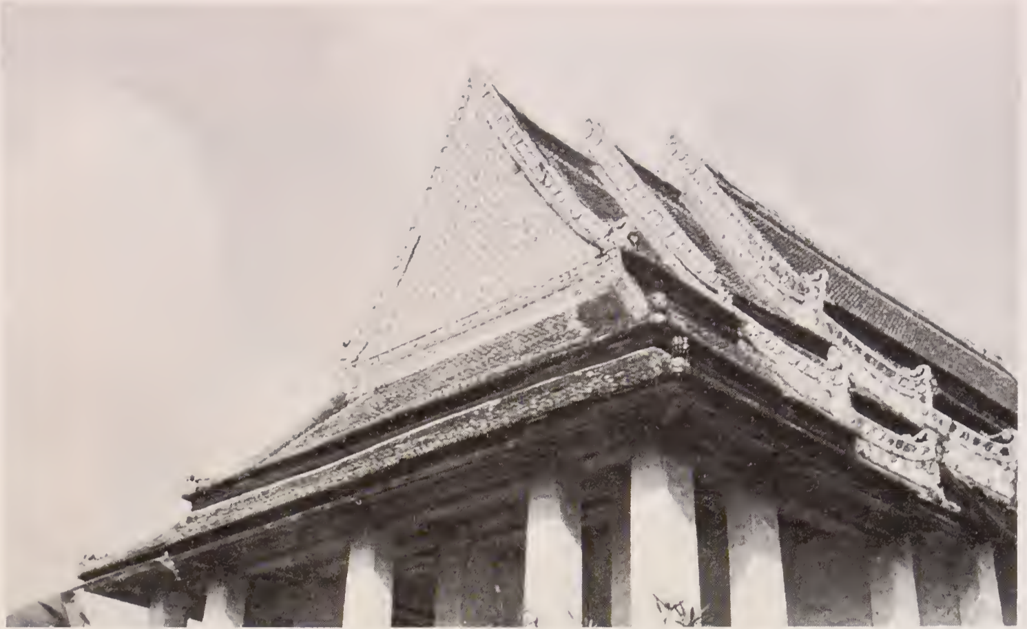
อุโบสถวัดประดู่ฉิมพลี