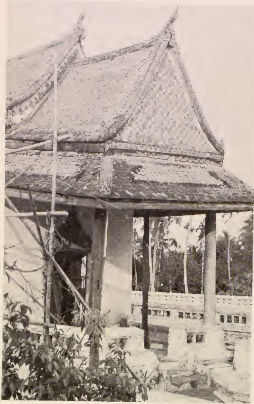
วิหารเมื่อยังชำรุดทรุดโทรมอยู่