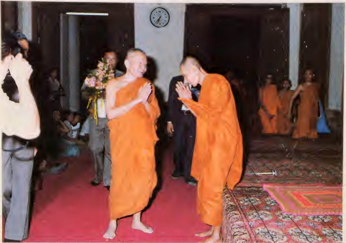
สมเด็จพระสังฆราชเสด็จมาในการทำบุญอายุ