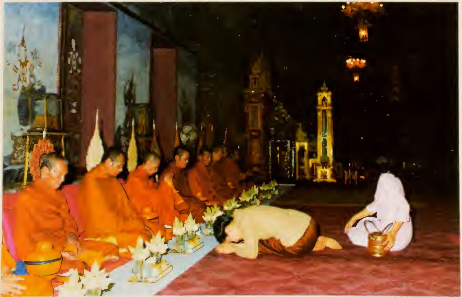
วันเสาร์ ที่ ๑๒ สิงหาคม ๒๕๒๑ สมเด็จพระนางเจ้าฯ พระบรมราชินีนาถ ทรง ประเคนจตุปัจจัยไทยธรรม เนื่องในการพระราชพิธีเฉลิมพระชนมพรรษา ณ พระที่นั่ง ไพศาลทักษิณ ในพระบรมมหาราชวัง