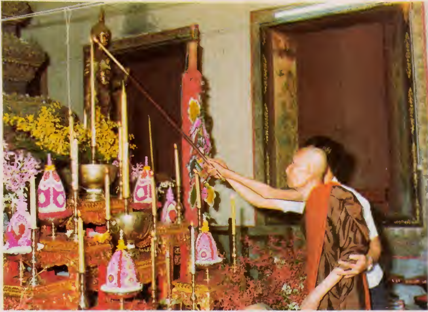
จุดเทียนมหามงคลในพิธีพุทธาภิเษกในอุโบสถวัดประดู่ฉิมพลี