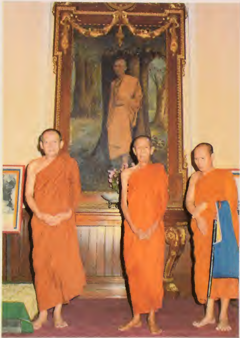
ฉายกับสมเด็จพระญาณสังวร ที่ตำหนักเพชร วัดบวรนิเวศวิหาร