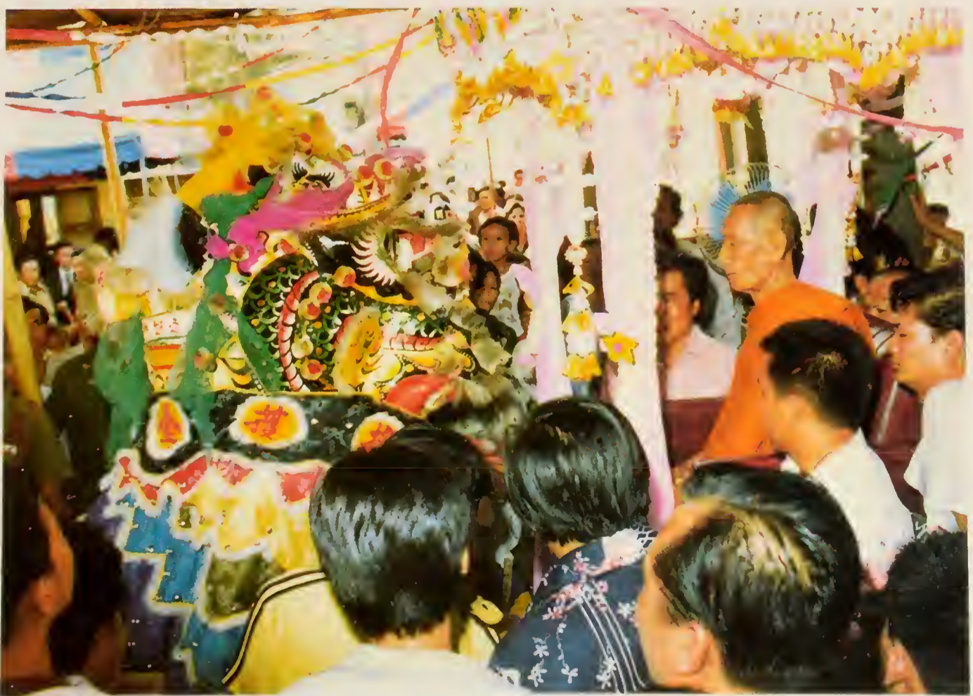
งานทำบุญอายุ ที่วัดประดู่ฉิมพลี