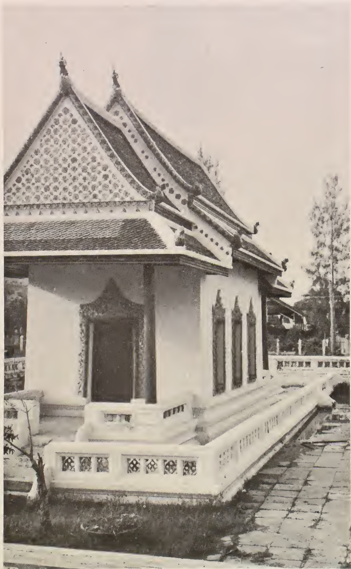
วิหารเมื่อปฏิสังขรณ์เรียบร้อยแล้ว