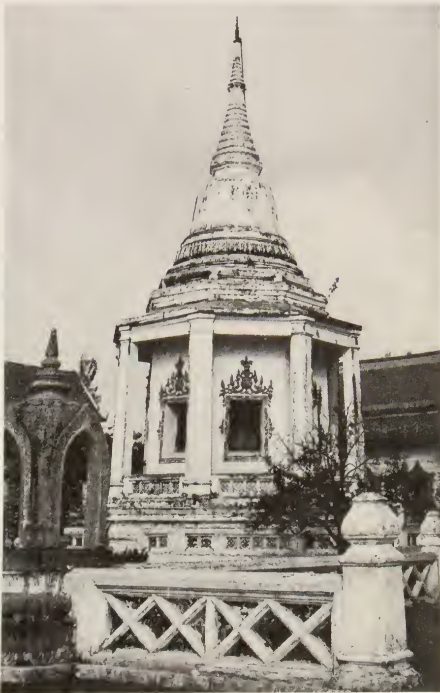
วิหารแปดเหลี่ยมยอดเจดีย์ ถ่ายจากอุโบสถ แลเห็นซุ้ม เสมาและกำแพงแก้วอุโบสถ ด้วย