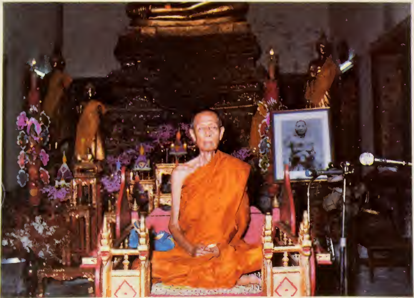
นั่งสมาธิในอุโบสถวัดประดู่ฉิมพลี