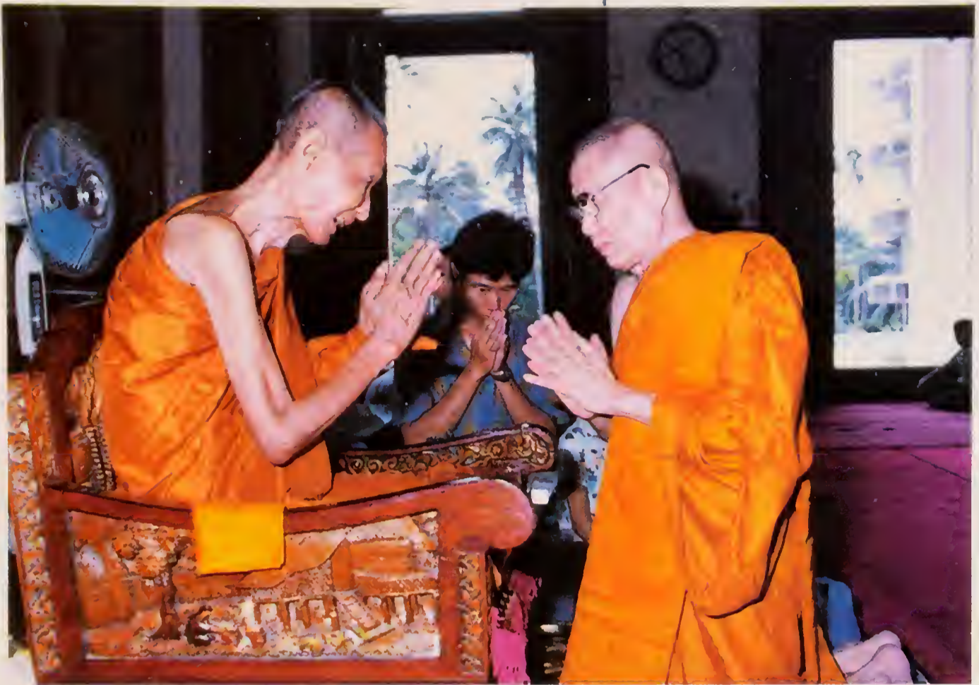
ฉายกับพระธรรมปัญญาจารย์ ในอุโบสถวัดประดู่ฉิมพลี