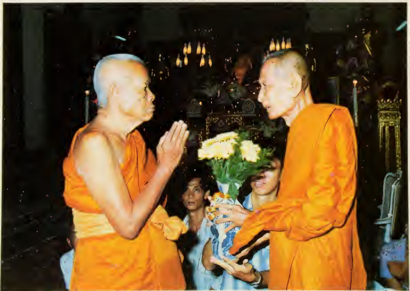
ฉายกับสมเด็จพระพุฒาจารย์ในอุโบสถวัดประดู่ฉิมพลี ในงานทำบุญอายุ