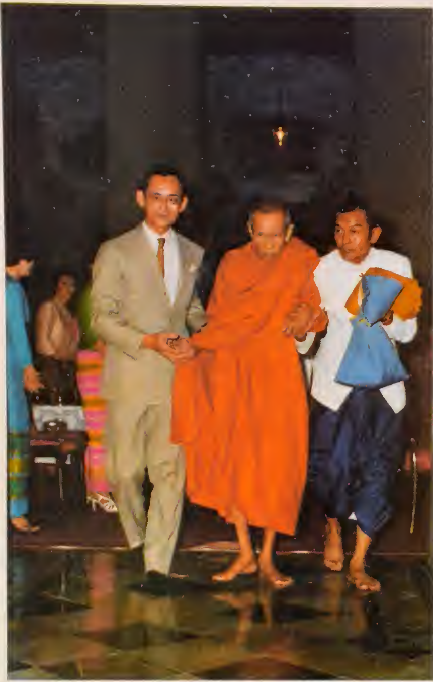
วันเสาร์ ที่ ๑๒ สิงหาคม ๒๕๒๑ พระบาทสมเด็จพระเจ้าอยู่หัว ทรง ประกอบพระราชสังวรภิรมณ์ ในการ พระราชพิธีเฉลิมพระชนมพรรษา สม- เด็จพระนางเจ้าฯ พระบรมราชินีนาถ ณ พระที่นั่งไพศาลทักษิณ ในพระ- บรมมหาราชวัง