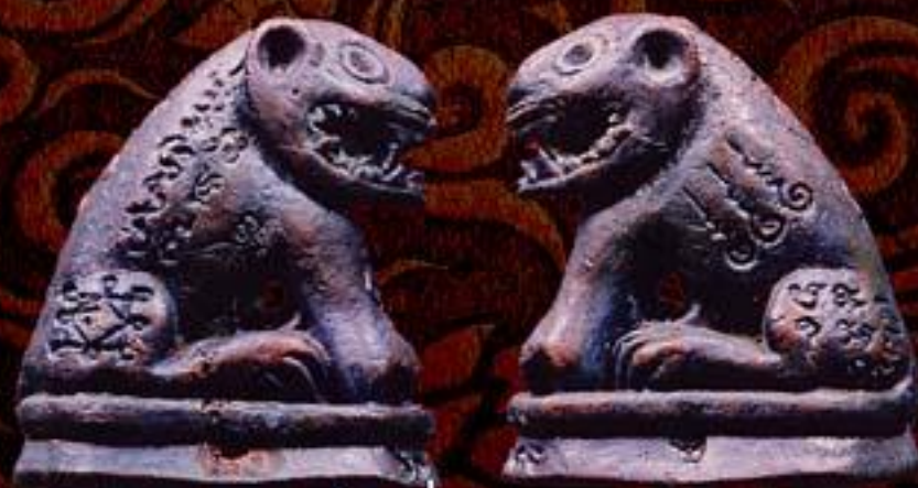
เสือ รุ่น 1