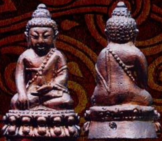
พระกริ่งบูรพาจารย์ รุ่น 1