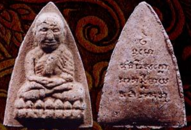
หลวงปู่ทวด ที่ระลึกสร้างวิหารบูรพาจารย์