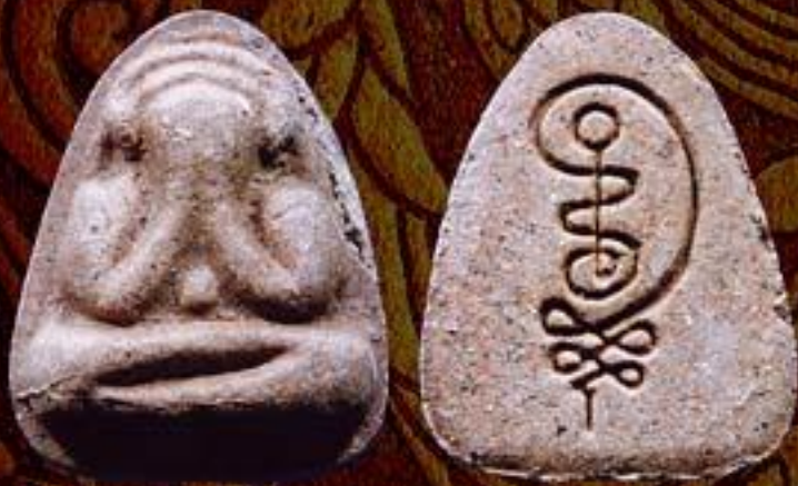
พระปิดตามหาว่าน 108 รุ่น 1