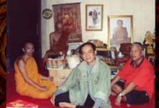
หลวงพ่อทบุเพชร วัดป่าภูมิพิทักษ์ สกลนคร