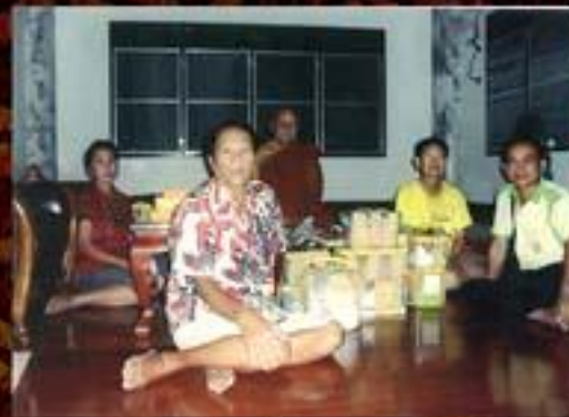
หลวงปู่ทวย วัดสมังคดาราม ศรีสะเกษ