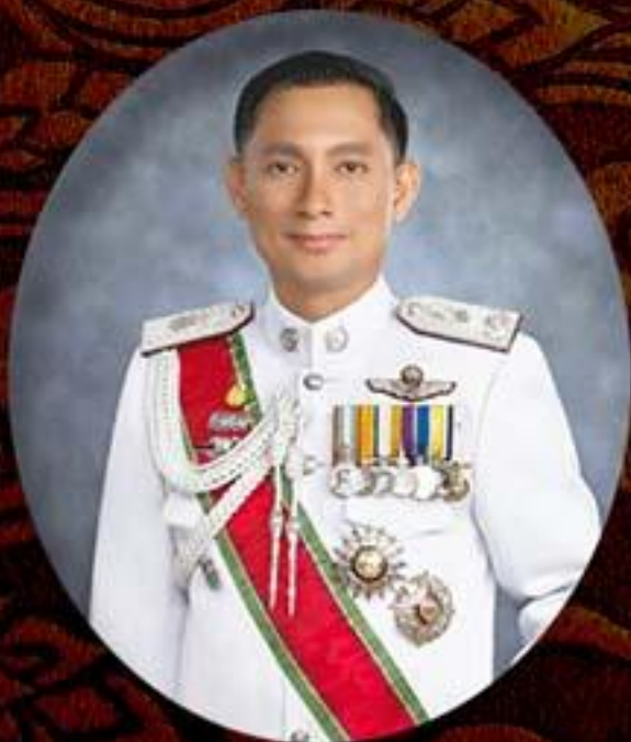
พล.ต.ต.ดร.สุวิระ ทรงเมตตา