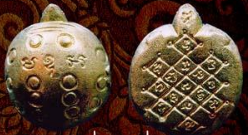
เตาเรื่อน รุ่น 1