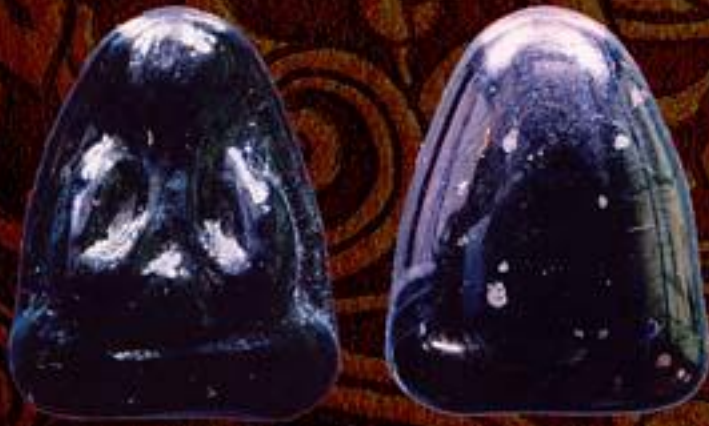
พระปิดตาแร่ไหลเพชรค่า รุ่น 1