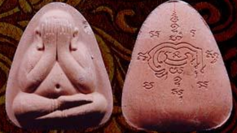
พระปิดตา เนื้อผงพุทธคุณ