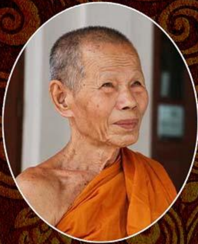
หลวงปู่บัว วัดเกาะตะเคียน ตรัง