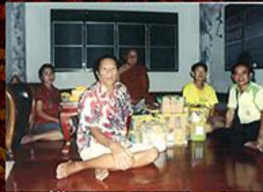
หลวงปู่ห้วย วัดสุ่มังคลาราม ศรีสะเกษ