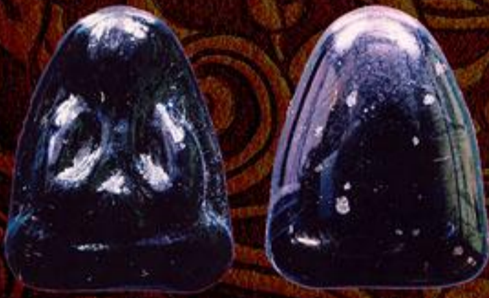
พระปิดตาแร่ไหลเพชรค่า รุ่น 1