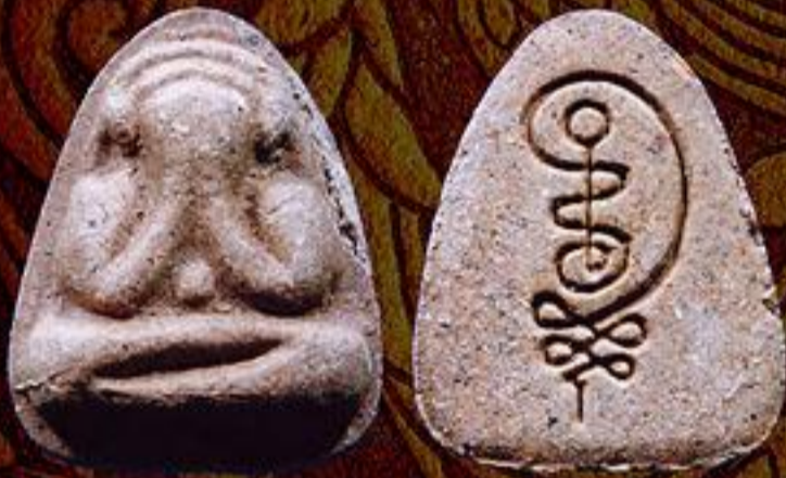
พระปิดตามหาว่าน 108 รุ่น 1