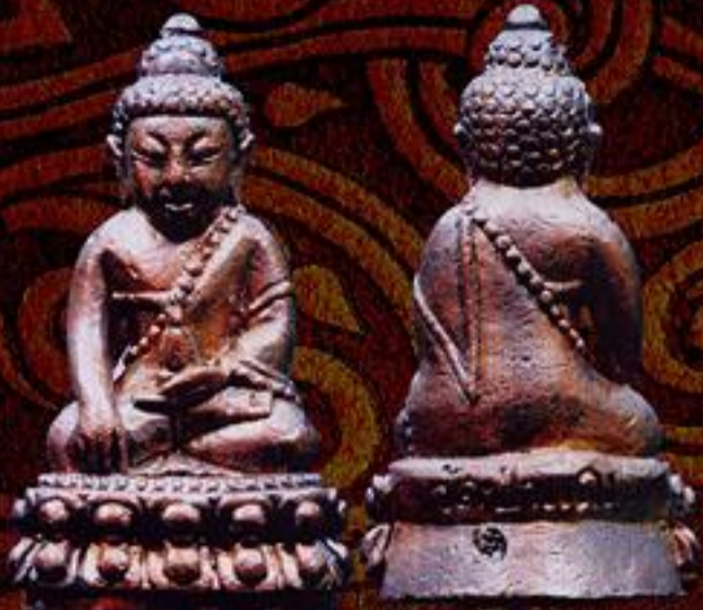
พระกริ่งบูรพาจารย์ รุ่น 1