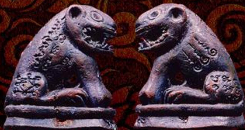
เสือ รุ่น 1