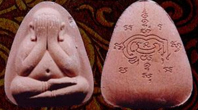
พระปิดตา เนื้อผงพุทธคุณ