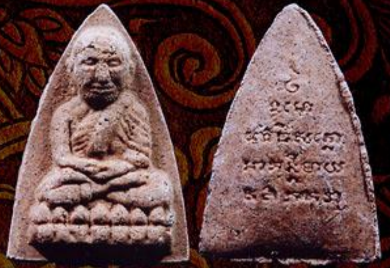
หลวงปู่ทวด ที่ระลึกสร้างวิหารบูรพาจารย์