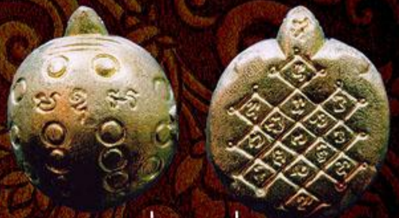
เตาเรือน รุ่น 1