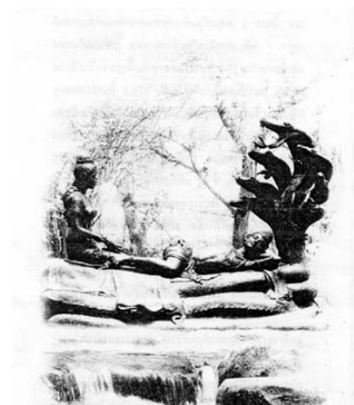
พระนารายณ์กับนางลักษมี