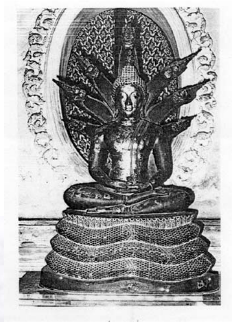
พระพุทธรูปปางนาคปรก บริเวณระเบียงรอบองค์พระปฐมเจดีย์ จังหวัดนครปฐม