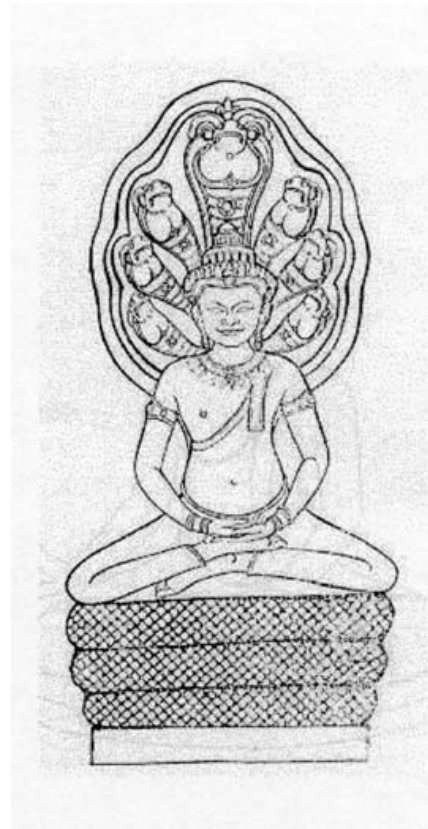
ภาพลายเส้นพระพุทธรูปปางนาคปรก