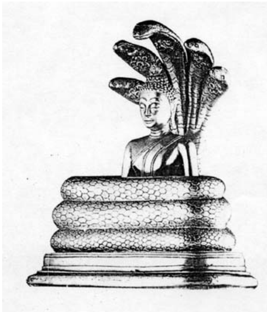
พระพุทธรูปปางนาคปรก